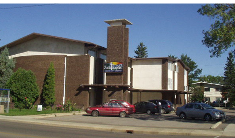
シオンバプテスト教会 エドモントン日系キリスト教会の新たな会堂

エドモントン教会の大きな変化は、別の会堂に引っ越したことです！ 昨年の12月から、シオン・バプテスト・コミュニティー教会において日曜礼拝を守っています。これまで28年以上に渡り、カバナント福音教会で礼拝をしてきましたが、車椅子使用可能な会堂が必要となり、今回の大移動を決定したわけです。新しい場所へ移ったことで、何だか“新鮮な”感じがしますし、教会再生への望みを先取りしているような感じもします。以前と同様、この会堂も借りているわけですが、シオン教会の皆さんは、私たちをととても温かく迎えてくださり、共にやっというお気持ちがよく伝わってきます。